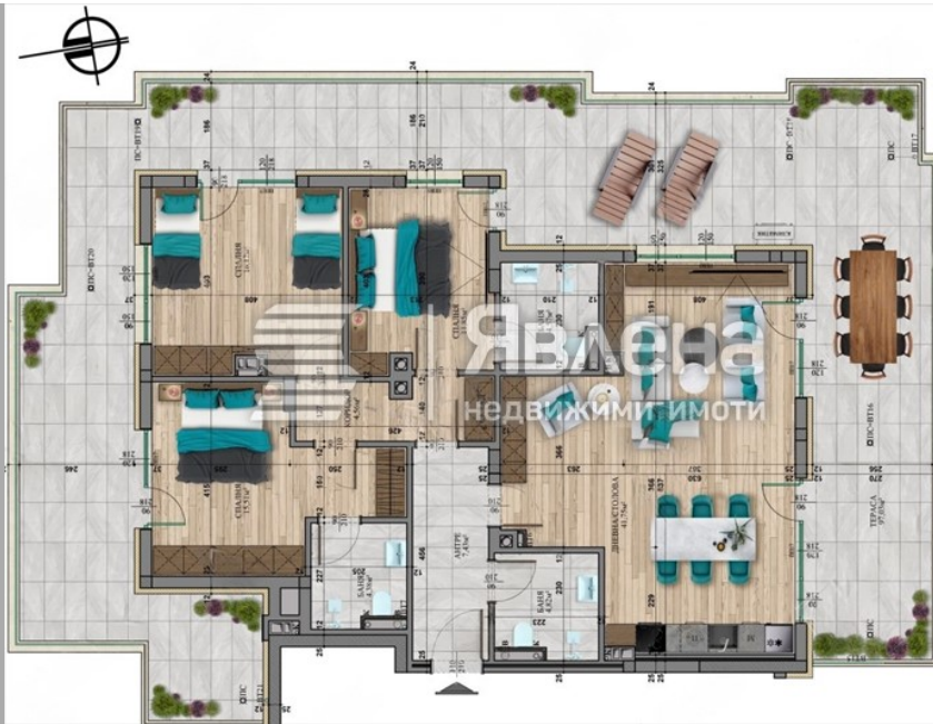
АПАРТАМЕНТ 22 - 136,04м 2 покривна тераса към ап.22 - 107,85м 2