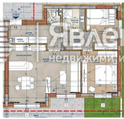
Разпределение апартамент по архитектура