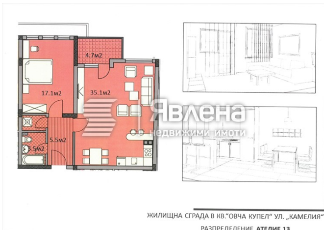
ЖИЛИЩНА СГРАДА В КВ. "ОВЧА КУПЕЛ" УЛ. „КАМЕЛИЯ“ РАЗПРЕДЕЛЕНИЕ АТЕЛИЕ 13